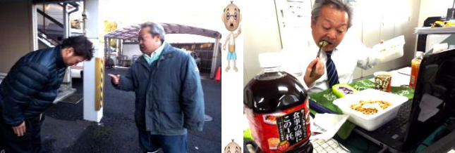
↑ドライバーへの指導中

痩せると誓ったあの日から、現在人生最重量 94kg達成！ 肉の首輪が拡大中！最近では階段がつらいです…(涙)