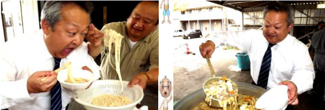
↑「そうめん大会」で激写