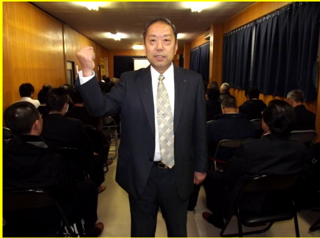
「3社」掛け持ちで多忙な社長にお話しを伺いました。