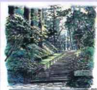
②朱雀/瑞鳳殿 (鳳凰) 50分