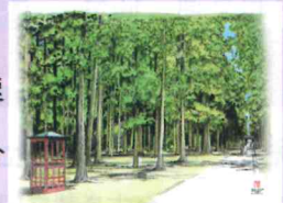
④青龍/松島瑞巖寺 80分