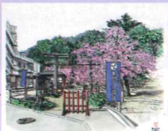
①玄武/亀岡八幡宮 30分